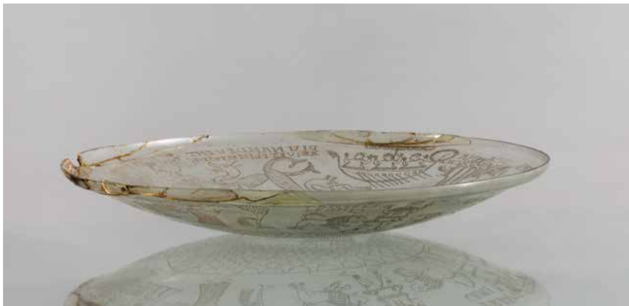
Сл. 1 Подгоричка здјела, поглед са стране / Fig. 1 Podgorica bowl, side view

Пуно својствености и недоречености које се везују за подгоричку чашу чине је јединственим примјерком касноантичке умјетности и неисцрпном темом за проучавање духовног полета тада тек озваничене хришћанске вјере. Било да је индивидуално изучавана или да се њоме посредно бавило, до данас је стекла несагледиво богату библиографију (Dumont 1873; Rossi 1874; Rossi 1877; Blant 1879, 231–233, Pl. XXIV; Garrucci 1880, 92–93, Tav. 463, 3; Mowat 1882, 295–297; Ljubić 1884, 39–42; Kisa 1908, 678–681; Leclercq 1914, 3008–3011, fig. 3336; Wulff 1914, 69–70, Abb. 55; Kaufmann 1922, 605; Пламенац 1949, 218–219; Ferte 1958, 110; Levi 1963; Ljubinković-Ćorović 1967; Ковачевић 1967, 263–264, ск. 17; Мижовић 1970, 91–93, сл. 4, II, III; Philippe 1970, 87–88, fig. 46; Банк 1977, 76; Salomonson 1979, 60–61, fig. 8; Мижовић 1980, 96, 110; Банк 1985, 275–276, Pl. 26–29; Finney 1994, 284–286, Fig. 7.4.; Нохха 2003, 118–121, Fig. 44; Залесская 2006, 249; Prigent 2007, 208–213; Spier 2007, 9–10, fig. 4; Hoek, Herrmann 2013, 215–216, Fig. 1; Nagel 2015).