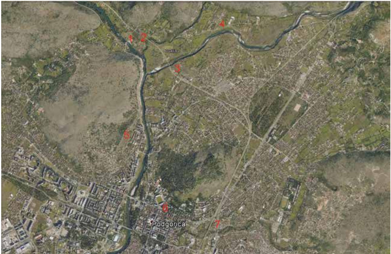
Сл. 6 Шира околина Подгорице са убиљеженим касноантичким гробним налазиштима: 1. Бјеловине, 2. Ловишта, 3. Загорич, 4. Стралићи-Прибој, 5. Мало Брдо, 6. ул. 19. децембар, 7. Ибричевина / Fig. 6 The wider surroundings of Podgorica with late Roman burial sites 1. Bjelovine, 2. Lovišta, 3 Zagorič, 4. Stralići-Pruboј, 5 Malo Brdo, 6. December 19 Street, 7. Ibričevina

ограду треба придружити још и непознату локацију на Малом Брду (сл. 6, 5), гдје је наводно откривена велика римска гробница на свод. 6 Касноантички гроб из улице 19. децембар налази се у непосредној близини цркве св. Ђорђа гдје је нађен велики број римских сполја међу којима се издваја и комад саркофага с приказом Меркура (Нешковић 1965–1966, 115; Stikotti 1999, 147). Њихово поријекло се везује за Доклеју али како су сондажна ископавања око апсиде цркве открила старије темеље, није искључено да сполје треба повезати са старијом грађевином на овом мјесту (Нешковић 1965–1966, 115, сл. 10–12). Међутим, та грађевина није временски детерминисана те не знамо да ли потиче из античког или раносредњевјековног