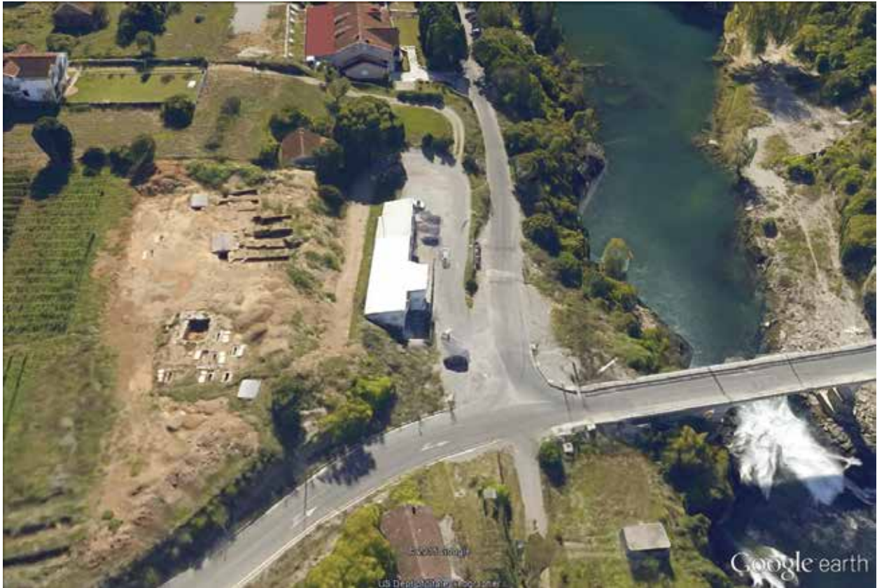
Сл. 7 Локалитет Бјеловине у току истраживања / Fig. 7 Site Bjelovine during the research

Турака и Црногораца (Blant 1879, 231). Не знамо одакле је Блант чуо ову новост која је занемарена у досадашњом проучавању чаше. Истовјетну вијест понавља Љубић, такође не спомињући одакле ју је добио. Он вели: Pokaza se radnikom, ti što su ondje kopali grabu za nekog ubijena u okršaju dugodivšem se tu na blizu među Turci i Crnogorci. Iz ruku tih radnika prođe u vlast g. Perroda... (Ljubić 1884, 39). Да ли је продавац ову информацију испричао првом познатом власнику Пероду или се у научној јавности с краја XIX вијека проширила нека усмена вијест можда посредством истраживача који су посјетили Доклеју, никада неће бити коначно јасно.