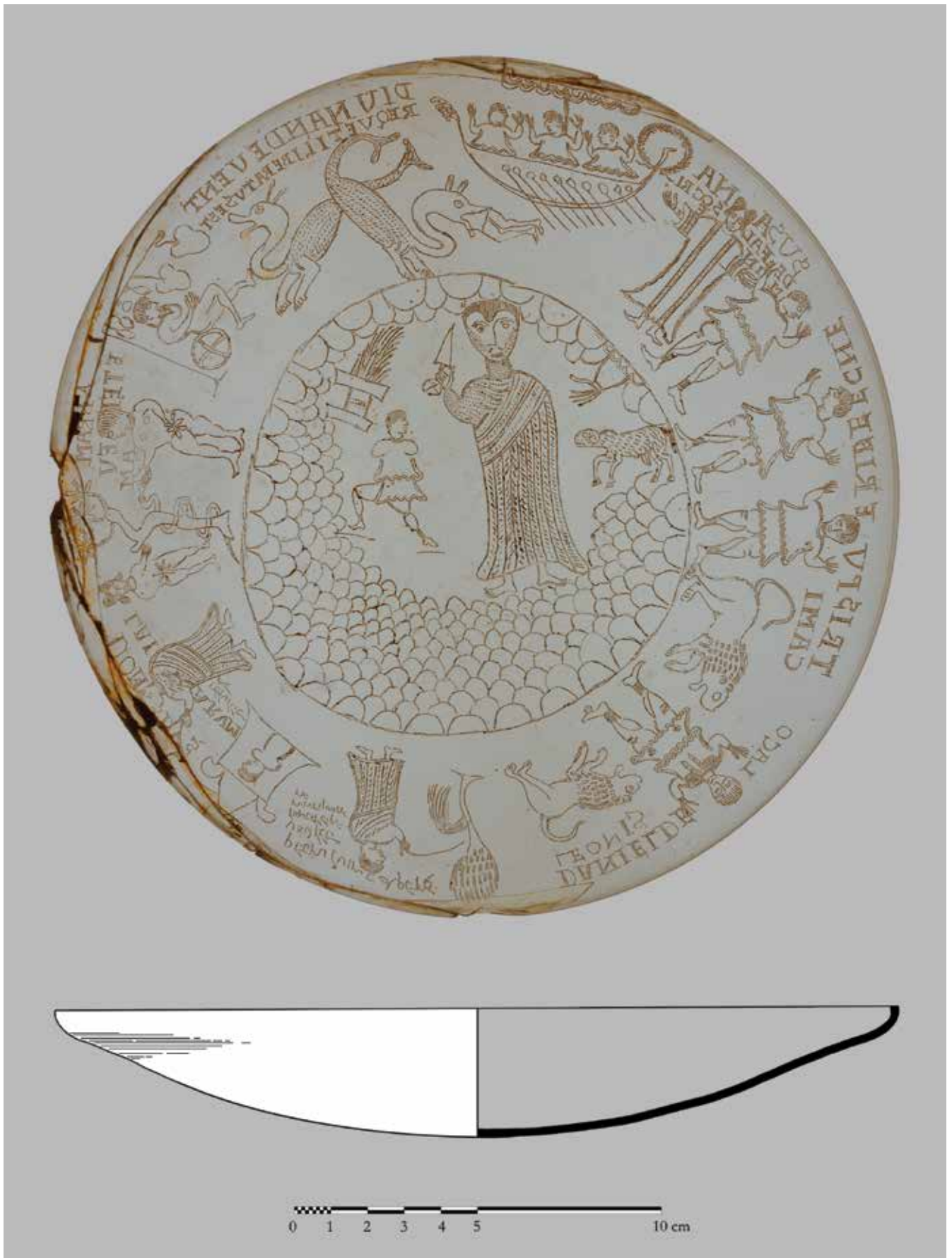
Сл. 2 Подгоричка здјела, изглед унутрашњости и пресека посуде / Fig. 2 Podgorica bowl, interior layout and section of the vessel