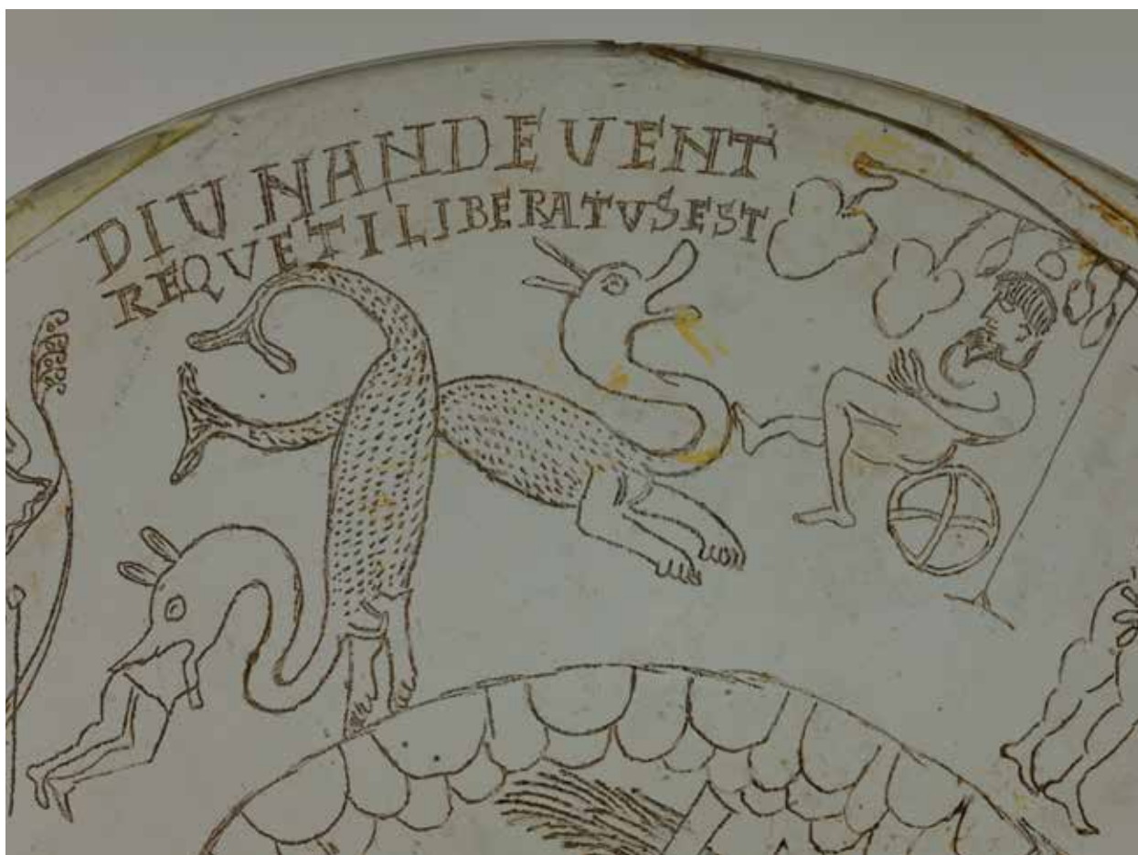
Сл. 3 Детаљ сцене Јона у утроби кита / Fig. 3 Detail of a scene Jonah in the belly of the whale

body are not spirally folded. In contrast, showing a cumbersome body which resembles a fish. Also, decorated with dots and short oblique strokes it also separates us from other well-known examples of which the body, by a rule, is smooth. The only analogy to our whale and body shape and decoration we found at long time published ceramic lamp (Garrucci 1880, 112, Tav. 475, 5), which belongs to the type Hayes IIA and is dated to the V and beginning of the sixth century (Hayes 1972, 314). However, the whale on the lamp is stockier, shorter tail and has a fringe on the chin, but the similarity in the general form does exist. Although, only on the basis of this similarity we cannot assume that the master of engraving representation regarding the described scene saw the lamp, which would also shift the dating in V / VI century.