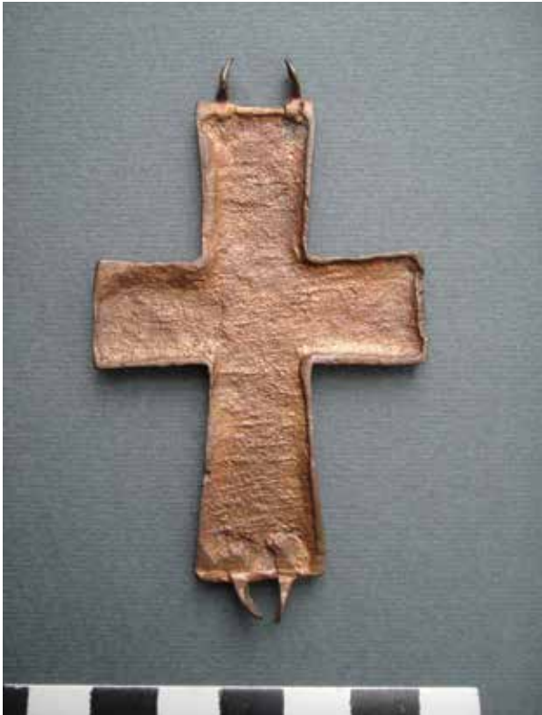
Fig. 3 - Valva di croce-reliquiario pettorale da Ostros, verso, Museo di Bar. Slika 3 – Polovina naprsnog krsta - relikvijara iz Ostrosa, poledina, Zavičajni muzej u Baru.