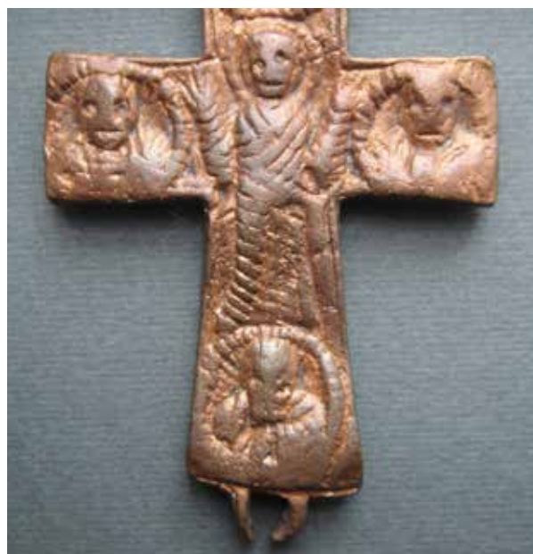
Fig. 8. Valva di croce-reliquiario pettorale da Ostros, recto , particolare, Museo di Bar. Sl. 8 – Polovina naprsnog krsta - relikvijara iz Ostrosa, Zavičajni muzej u Baru, poledina, detalj, Zavičajni muzej u Baru.

sa obožavanjem iste od strane careva i carske porodice 39 . Između jedanaestog i dvanaestog vijeka svjedoči se o rastu proizvodnje ikona u mermeru, koje su često prikazivale upravo lik Bogorodice (Teotokos) 40 . Naporedo s umjetničkim izborima diktiranim ukusom klijentele iz visokih krugova, predstave vjerskih ličnosti, kao što su Hrist, Bogorodica i sveci, na vijeka, potvrđuju, na primjer, ukrasi srednje-vizantijskih amajlija, koje su namjenjivane za zaštitu materice i borbu protiv krvarenja, Pitarakis B. 2006, str. 87-89.