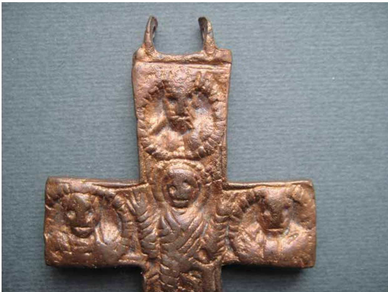
Fig. 2 - Valva di croce-reliquiario pettorale da Ostros, recto, particolare, Museo di Bar.

Slika 2 – Polovina naprsnog krsta - relikvijara iz Ostrosa, poledina, detalj, Zavičajni muzej u Baru.