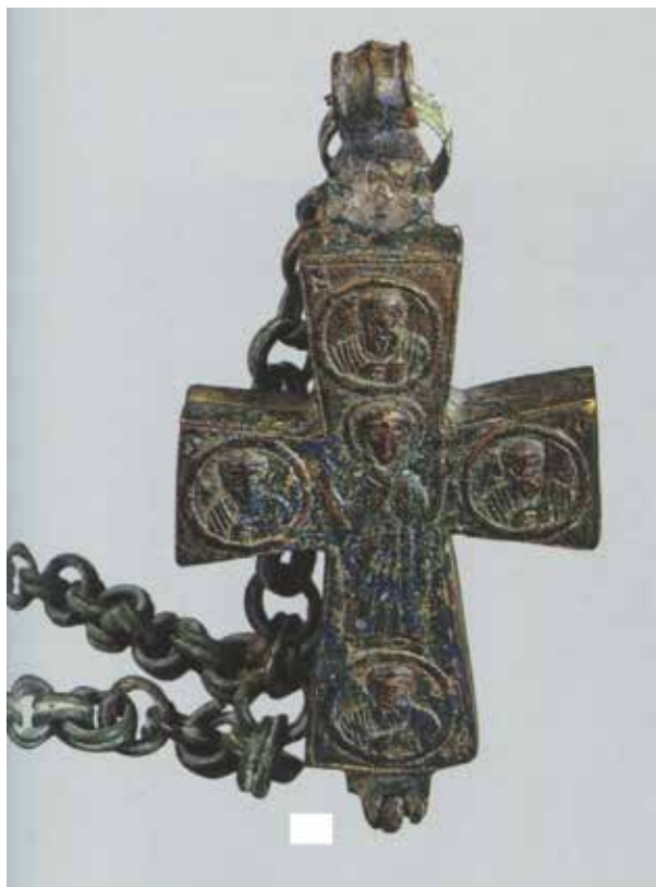
Fig. 7 – Croce reliquiario pettorale integra, con appiccagnolo e catena passante, Museo Civico di La Spezia (da Il medioevo in viaggio , a cura di B. Chiesi, I. Ciseri, B. Paolozzi Strozzi, Firenze 2015, cat. 53, p. 183).

Slika 7 – Naprsni krst - relikvijar iz Ostrosa u cjelini, sa pripadajućom krunicom i provučenim lancem, Gradski muzej u La Speciji ( Il medioevo in viaggio , uredili B. Kijezi, I. Cizeri, B. PaolociStroci, Firenca 2015, kat. 53, str. 183).