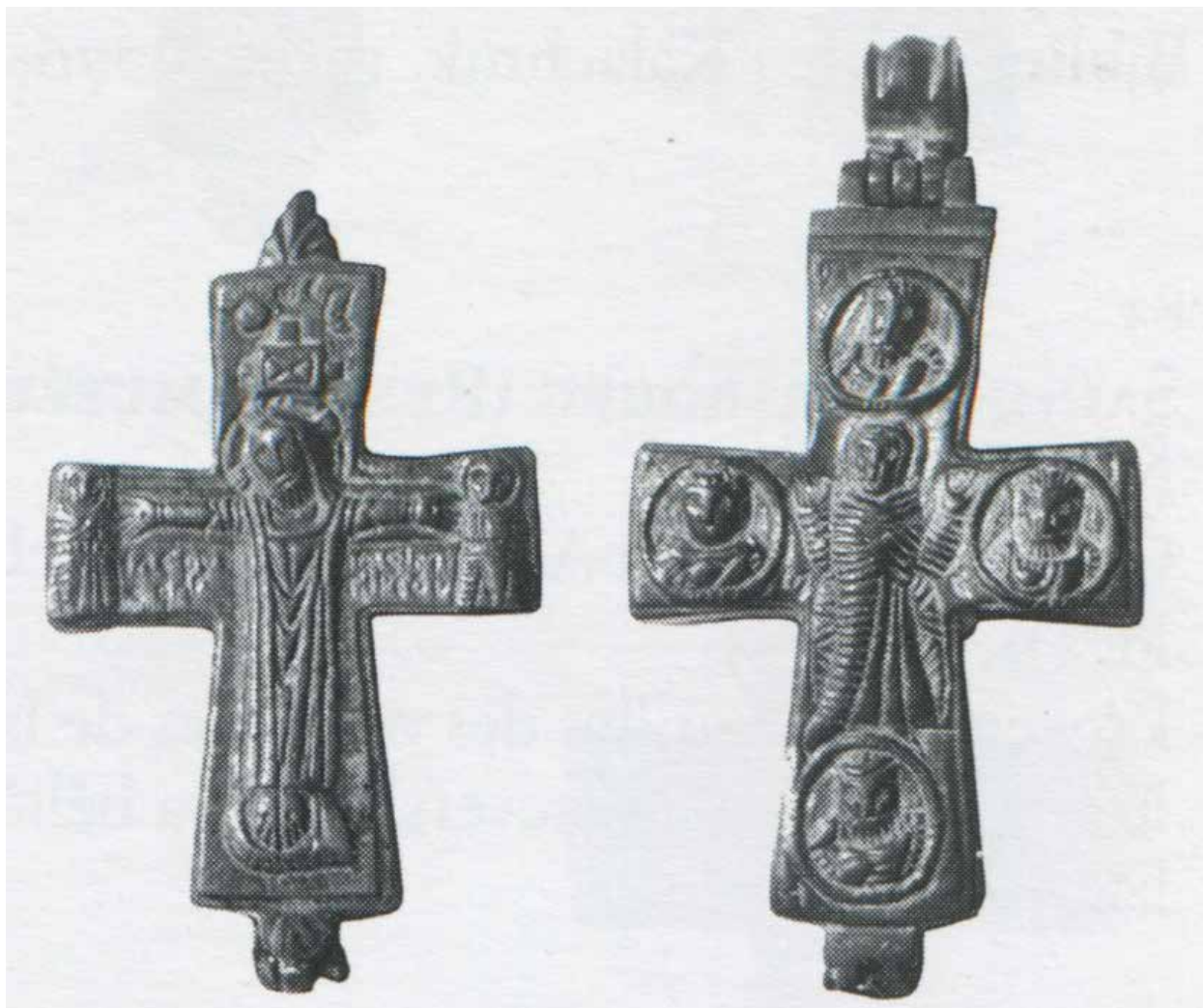
Fig. 9 - Croce reliquiario pettorale in bronzo (da B. Pitarakis, Les croix-reliquaires pectorales byzantines en bronze , Paris, 2006, cat. N. 80, p. 211).

Slika 9 – Bronzani naprsni krst–relikvijar (B. Pitarakis, Les croix-reliquaires pectorales byzantines en bronze , Pariz, 2006. god, kat. br. 80, str. 211).