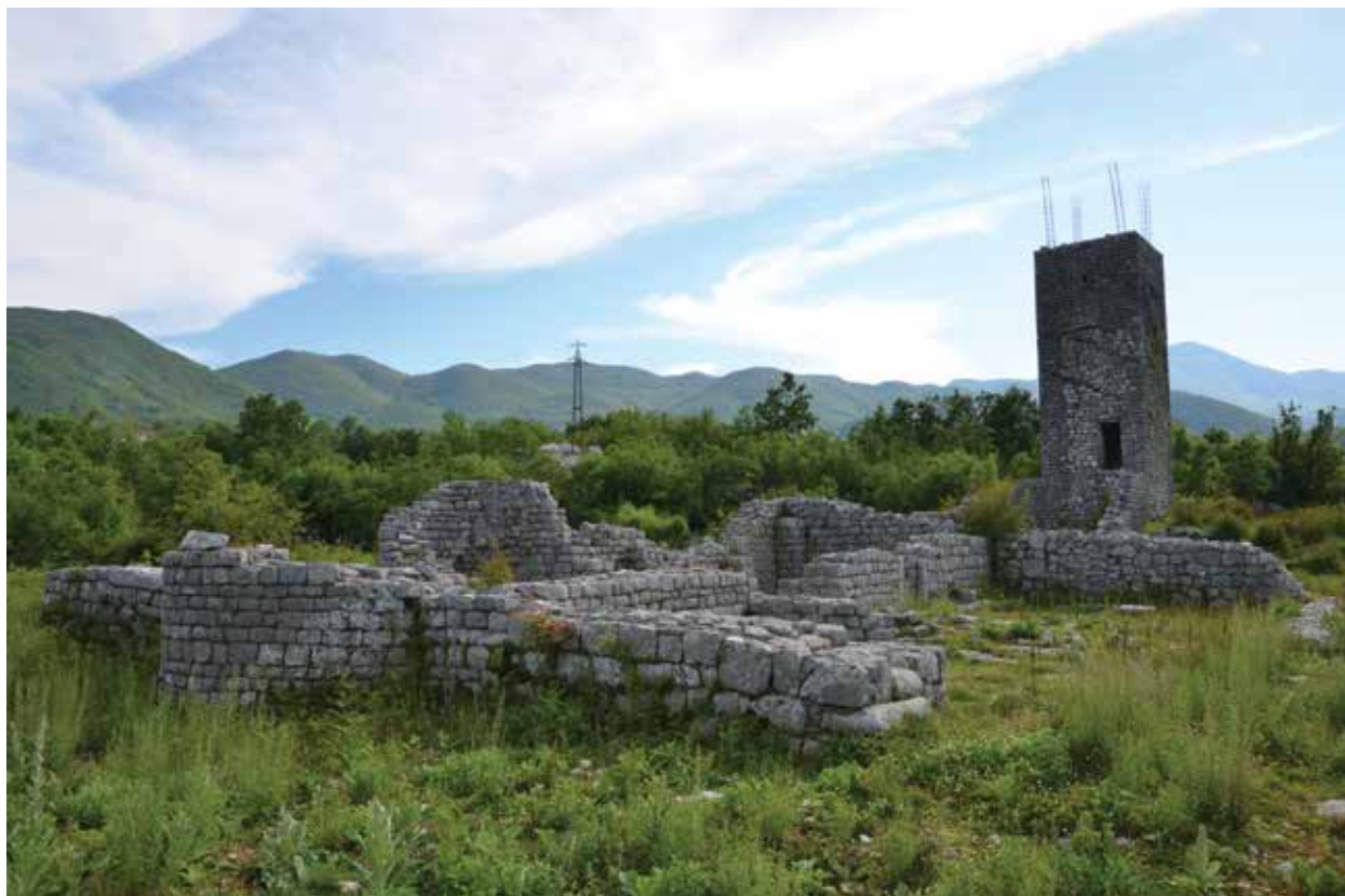
Fig. 4 Il sito monastico di Ostros, (foto autore 2014). Sl. 4 – Lokalitet manastira u Ostrosu (fotografija autora, 2014. god).