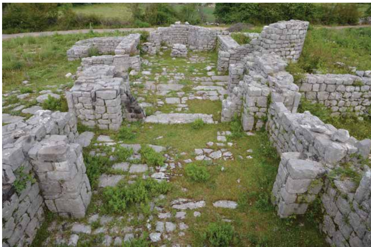
Fig. 5 - Prečista Krajinska, edificio triconco, interno. Slika 5 – Prečista Krajinska, trikonhalna građevina, unutrašnjost.