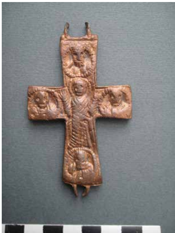
Fig. 1 - Valva di croce-reliquiario pettorale da Ostros, recto, Museo di Bar.

Slika 1 – Polovina naprsnog krsta - relikvijariz Ostrosa, poledina, Zavičajni muzej u Baru.